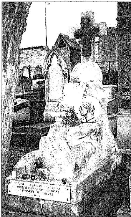
Grób J. Słowackiego w Paryżu.

myśleniu Słowackiego w stosunku do programu ideowego Wielkiej Emigracji, która wierzyła w niepodważalne wartości patriotyzmu i poświęcenie się dla ojczyzny bez względu na realia społeczno-polityczne. Oficyny wydawnicze we wszystkich trzech zaborach zaczęły wydawać dzieła Słowackiego obok utworów Mickiewicza i Lelewela. Sukces Słowackiego był niewątpliwy. Był on poetą narodowym i zamierzał również opisać prastare dzieje Polski w formie baśniowych udratyzowanych kronik historycznych. Zamyśl olbrzymi i spełniony tylko w części. „Balladyna” i „Lilla Weneda” są jedynymi utworami świadczącymi o planach poety. Któż z nas nie ma zamiarów, które z najróżniejszych powodów spalają na panewce nie przynosząc oczekiwanych rezultatów. Tyle innych „ważniejszych” rzeczy dzieje się w życiu, że czasem wartościowe pomysły odsuwane są w przyszłość czekając na odpowiednie warunki, aż w końcu, nie wiadomo kiedy, stają się przeszłością.